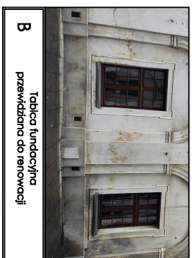
B Tablica fundacyjna przewidziana do renowacji